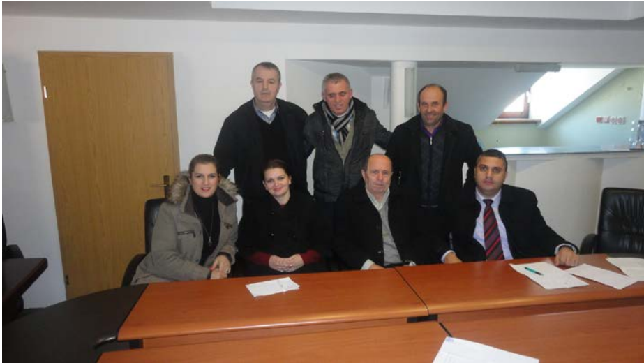
KKK - Prishtina