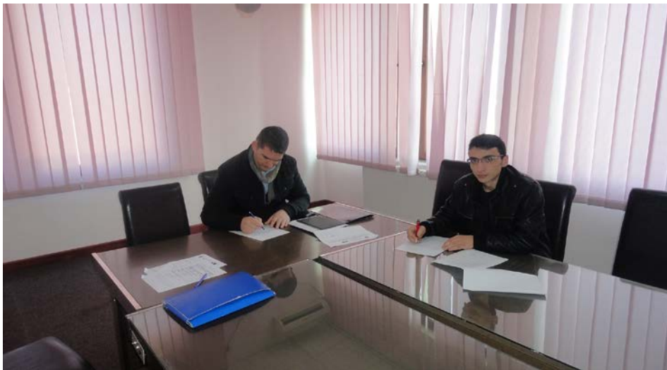
KKK - Gjakova