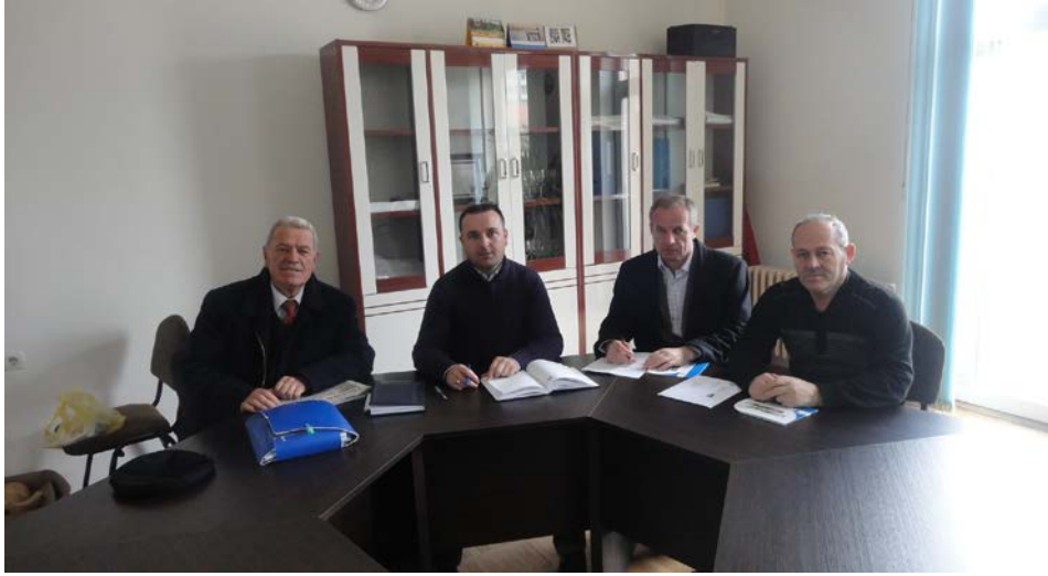
KKK – Ferizaj