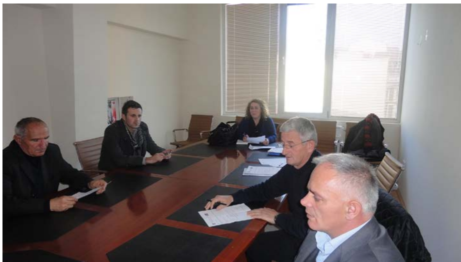
KKK - Peja