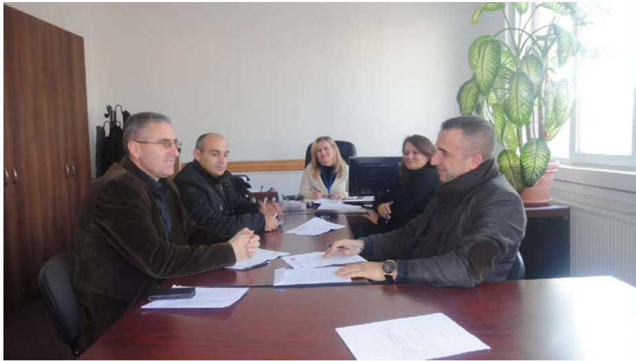
KKK - Gjilan